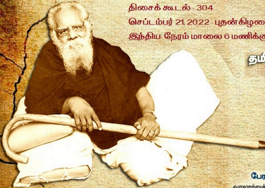
ஈ.வெ.ரா (பெரியார் 17.09.1879 - 24.12.1973)